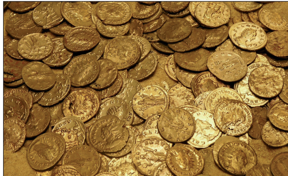
Der Wunsch vor jeder Trauung: Gesundheit, Glück und Gold.

2. Zustimmung der Ehefrau zum Verkauf des Goldschmuckes. Wenn jedoch der Ehemann beweisen kann, dass die Ehefrau ihm den Schmuck gegeben hat, ohne dass er diesen zurückgeben musste und das mit dem Willen der Ehefrau der Schmuck verkauft und Hausratssachen verwendet wurde, dann muss er ihn nicht herausgeben.