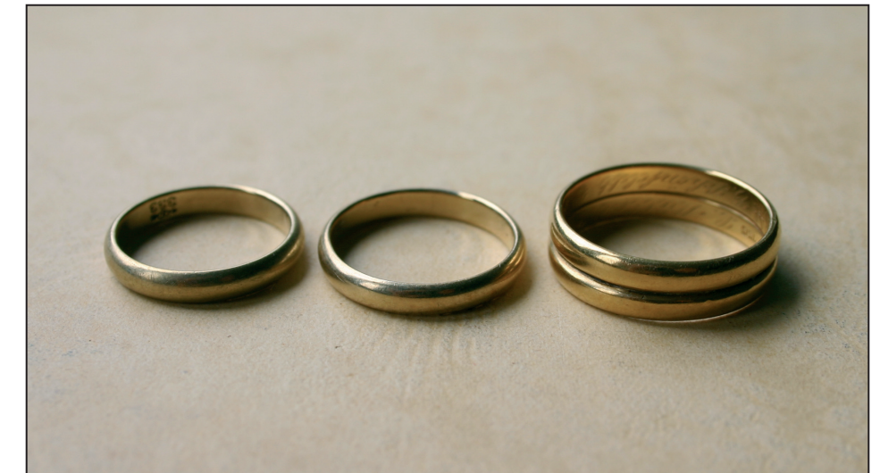
Nicht immer eine runde Sache: Wer bekommt das Gold?